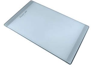
Tabla de corte de cristal 8631 300